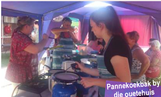
Pannekoekbak by die ouetehuis