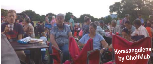
Kerssangdiens by Gholfklub