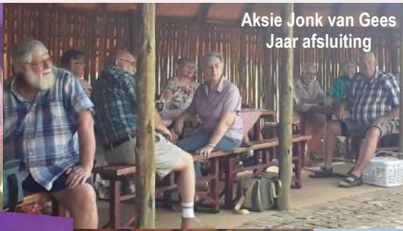
Aksie Jonk van Gees Jaar afsluiting